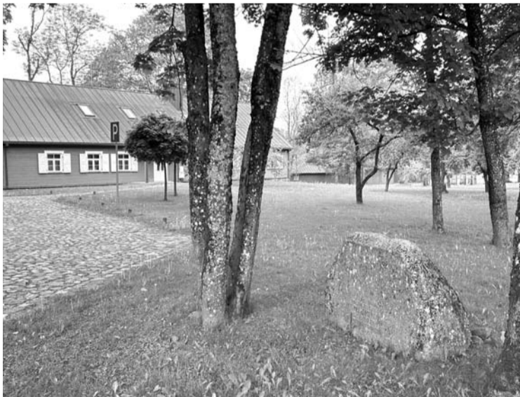
Šis akmuo stovi šventojo Aleksandro Neviškio cerkvės patvoryje. Ant jo puikuojasi sovietinės ideologijos ženklai.