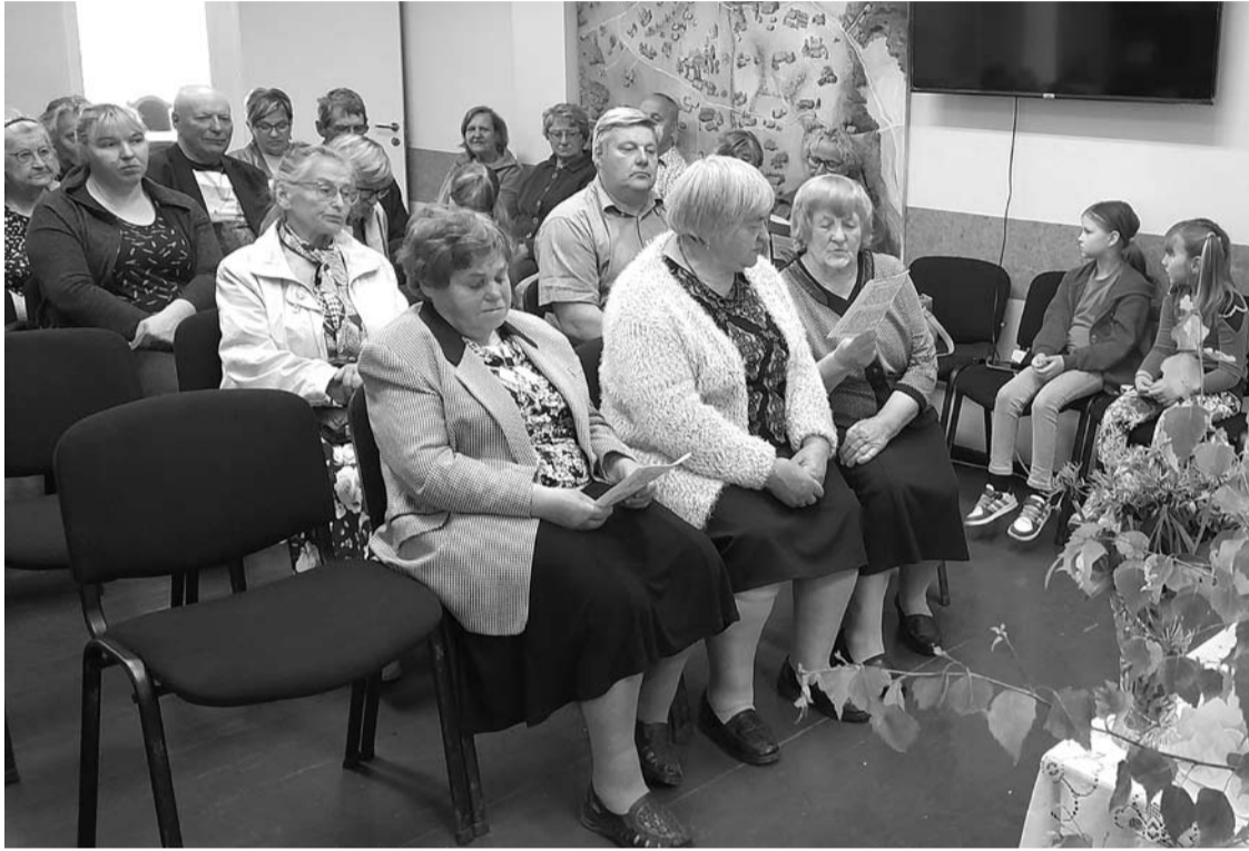
Budrių bendruomenės namuose, kurie yra Šovenių kaime, kelis vakarus iš eilės į mojavą renkasi Budrių ir Šovenių kaimų tikintieji.

Tiesa, tokio pobūdžio pamaldos Budrių bendruomenės namuose šiemet vyko pirmą kartą ir net ne visą gegužės mėnesį – artėjant Sekminėms suskubta prisiminti ir bent kažkiek sugrąžinti buvusią tradiciją.